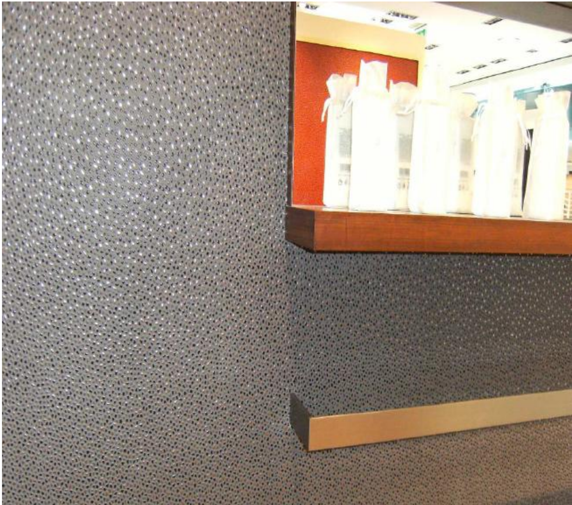
Efeito final do material depois de uma colocação de forma incorreta.